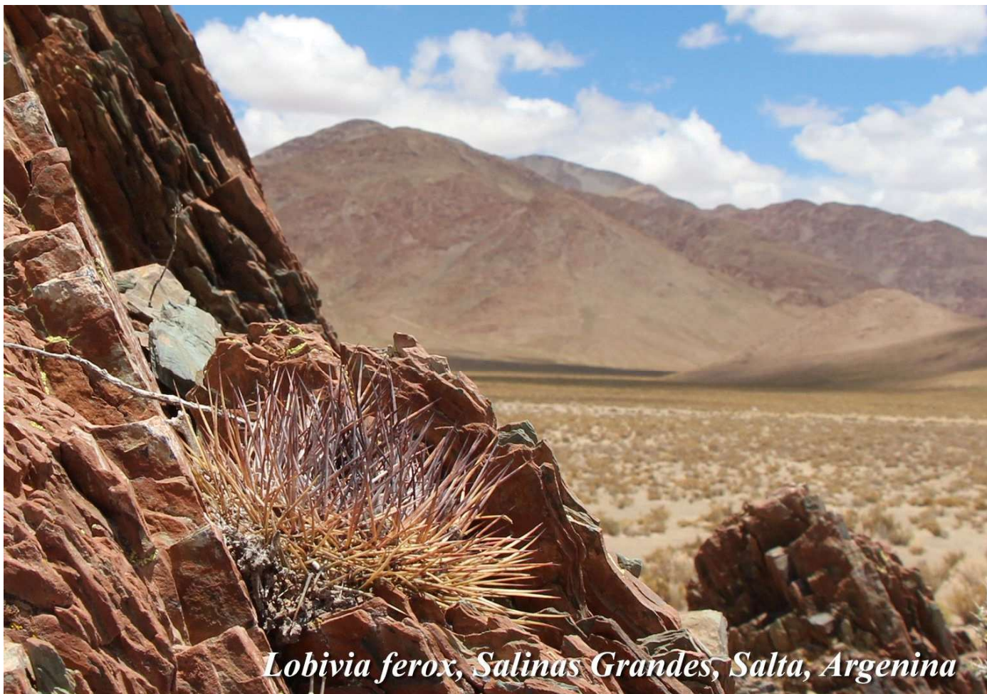
Lobivia ferox, Salinas Grandes, Salta, Argentina