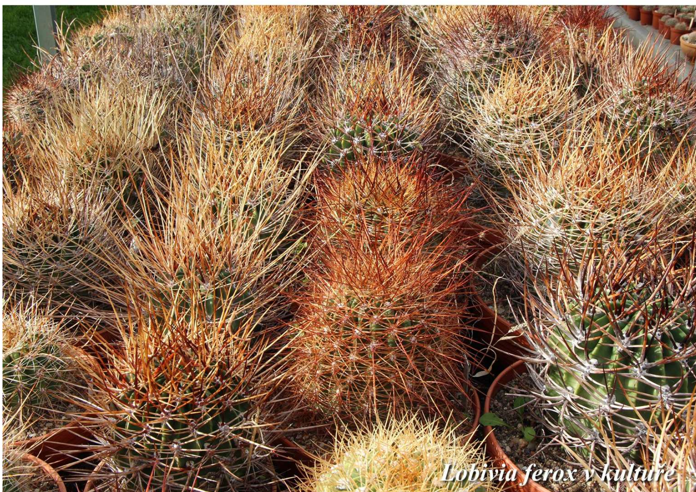
Lobivia ferox v kultúre