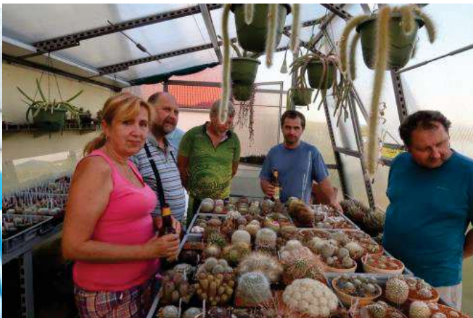
1.8. u Sikorů v Klabavě