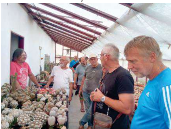
25.7. u Hájků v Třemošné