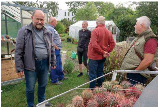
8.8. u Němečků Zátíší