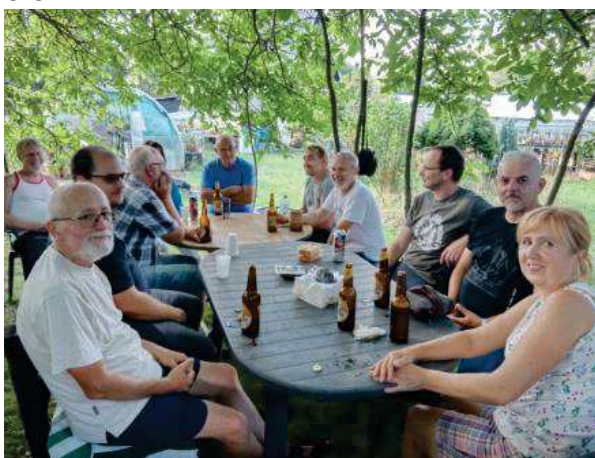
22.8. u Looseů v Záluží