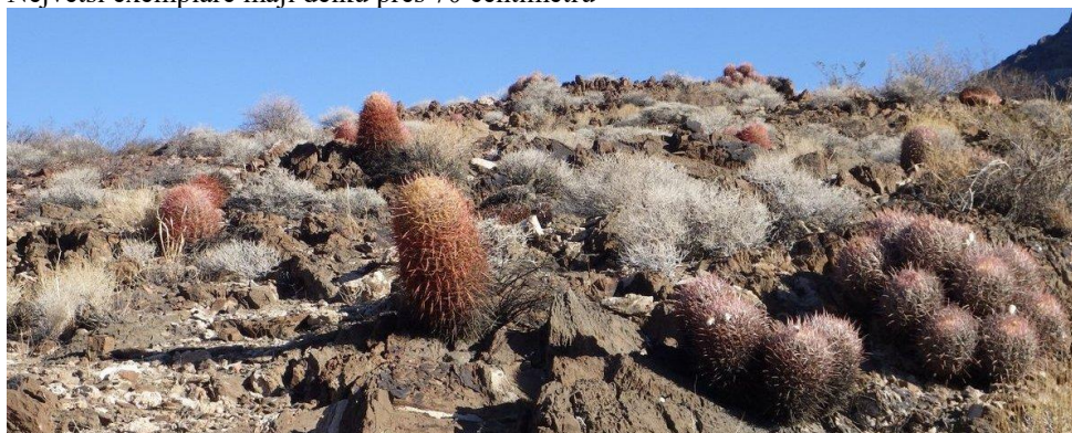
Mimořádně hustá populace Echinocactus polycephalus společně s Ferocactus acanthodes