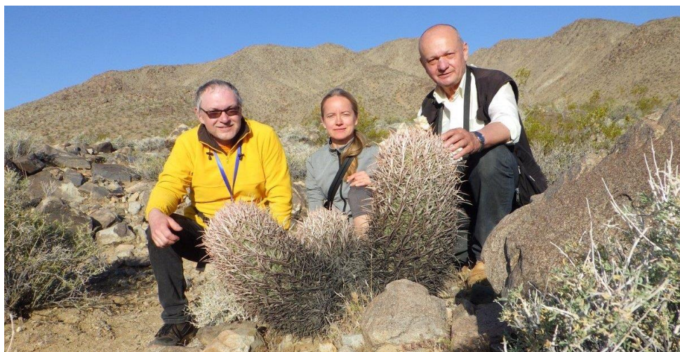
Největší exempláře mají délku přes 70 centimetrů