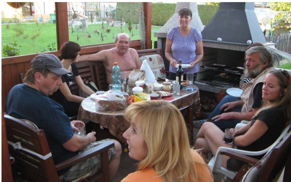
U Rousů, září 2013