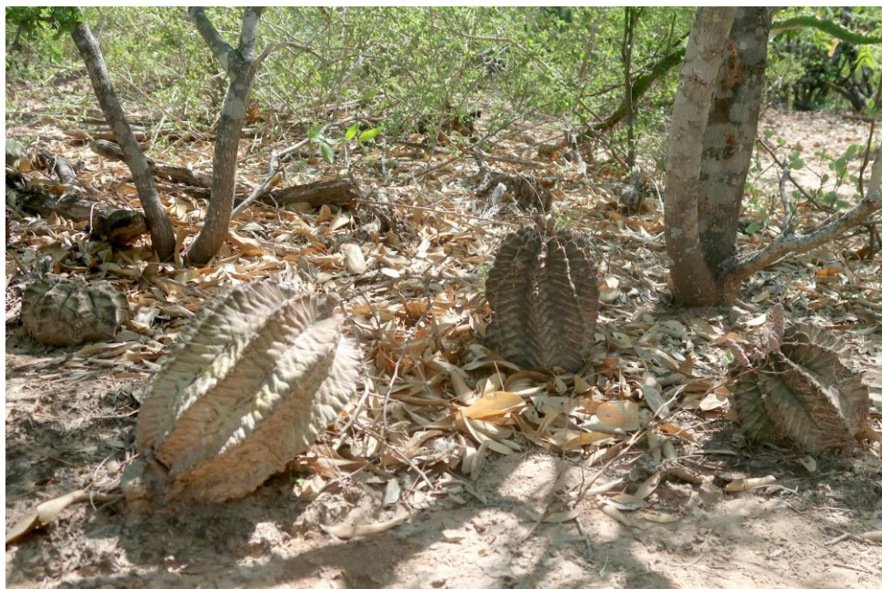
jeden vedle druhého, jako když u nás najdete v mláži čerstvě narostlé hříby