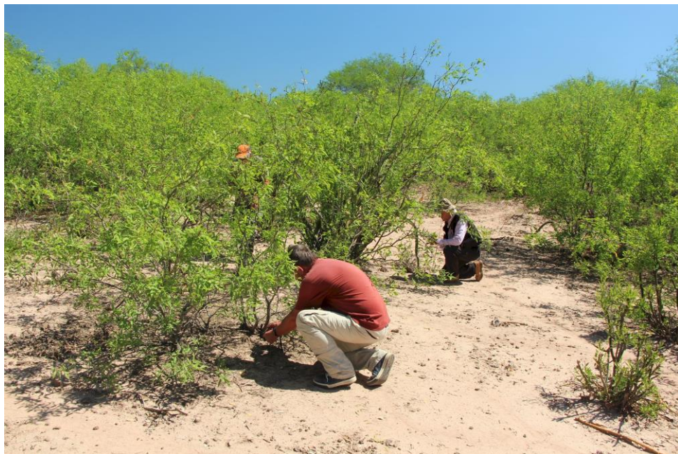
na lokalitě Gymnocalycium mihanovichii