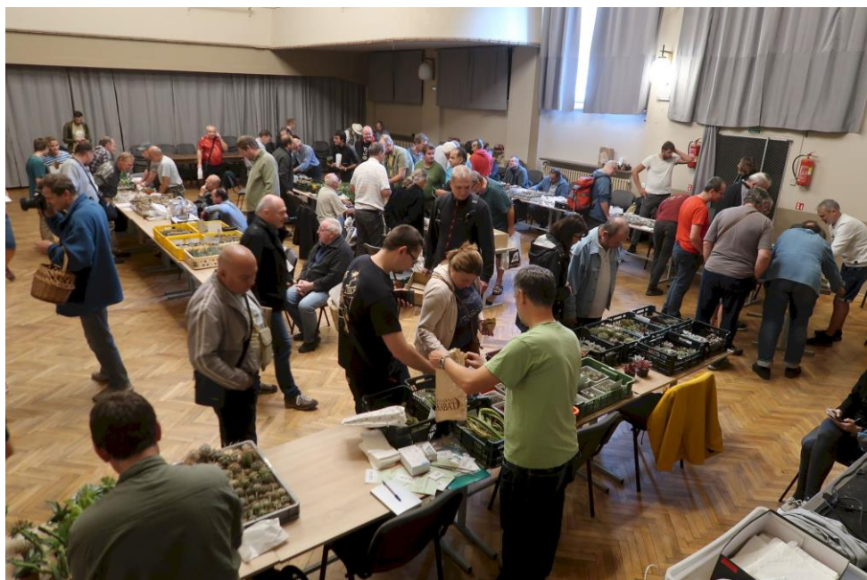
burza rostlin na Plzeňském kaktusářském kolokviu