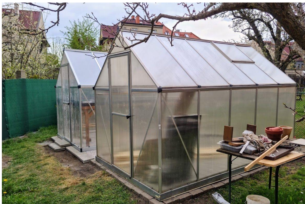
oba skleníky již stojí na svých místech pohled do skleníku