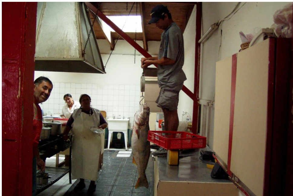
pohled do kuchyně restaurace, kde právě probíhá vážení ryby rybí filet ve speciálním těstíčku