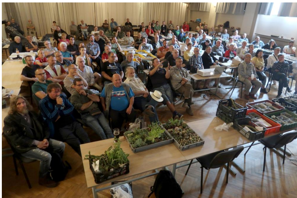
účastníci Plzeňského kaktusářského kolokvia sledují přednáškový program