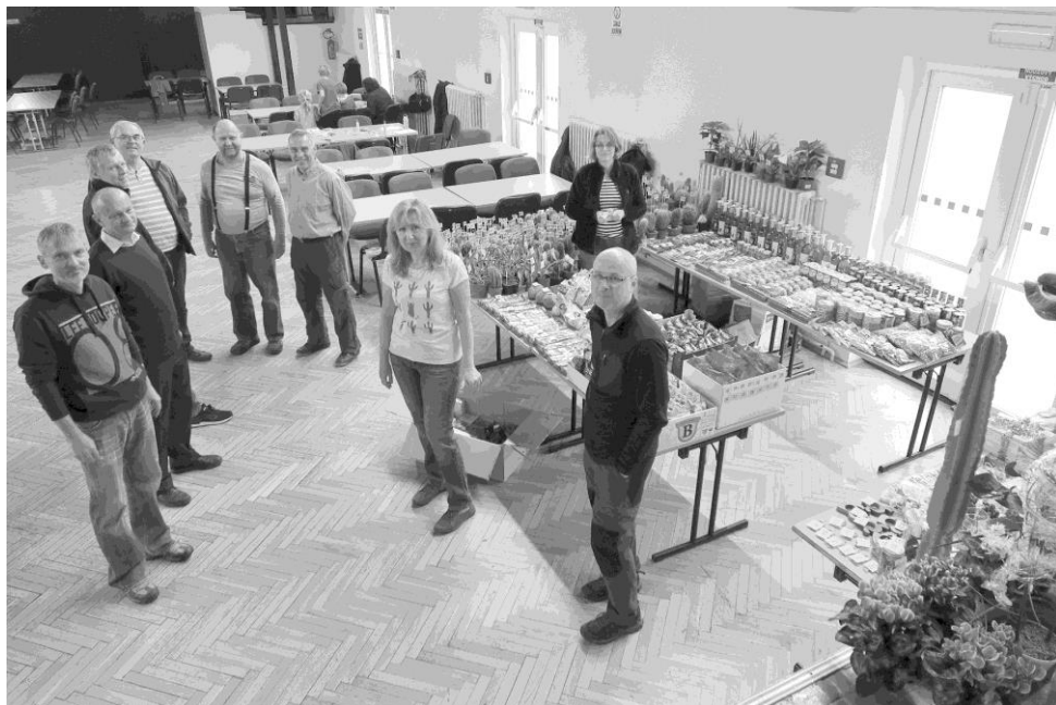
tombola pro kaktusářský bál je připravena

Dne 24. listopadu 2018 se konal 34. kaktusářský bál Klubu kaktusářů Plzeň, který měl název „Legendární“. Tradičně se konal v kulturním zařízení Šeříkovka v Plzni na Slovanech. Tři měsíce před bálem nám nový provozovatel Šeříkovky (akciová společnost Sylván) oznámil výši nájmu, byla 2,5x větší než vloni. Museli jsme přistoupit ke zdražení vstupenek a modlili jsme se, jestli se prodají všechny lístky. Naštěstí věrní návštěvníci bálu potvrdili účast a někteří přivedli i další známé. Proдалo se 219 vstupenek z 225, což bylo dobré. Proдалo se i všech 720 cen tomboly, takže nakonec bál nebyl ztrátový. Všichni účastníci bálu byli spokojeni, panovala bujará zábava. Kapela Classic Band byla skvělá, všemi chválená.