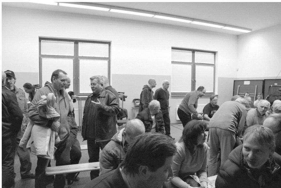
Pohled do pingpongové hery, kde probíhaly přednášky, vzadu organizátoři

Oběd formou švédského stolu. Kdo měl na co chuť, si pochutnal. Pro některé káva.